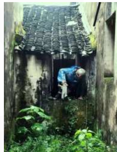
太湖蓬莱三山岛体验培训